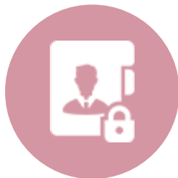
機密保持システム